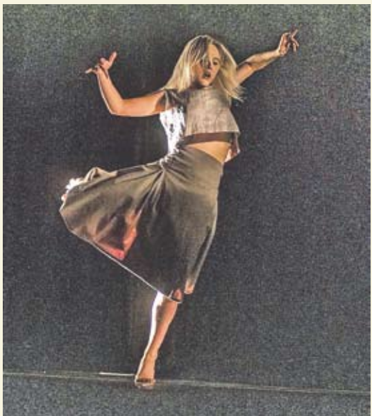
Klaipėdos pilies muziejaus Friedricho poternoje